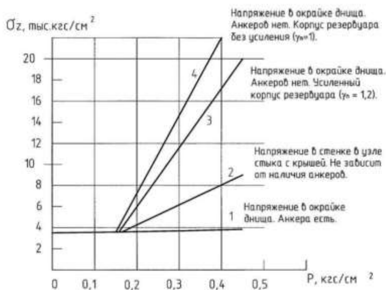
Рис. 3. Меридиональное напряжение \sigma_z в узлах стыка стенки резервуара с днищем и крышей при действии гидростатической нагрузки и избыточного давления P .

При отсутствии анкеров окрайка днища сильно деформируется, и напряжения в узле стыка стенки с днищем оказываются выше напряжений в узле стыка стенки с крышей (линии 2, 3 и 4 на рис. 3). Поэтому при обрыве анкеров в первую очередь должен произойти отрыв стенки от днища, что и имело место в Ионаве.